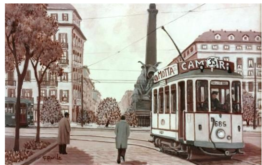
mostra quadri Biblioteca Civica Milano (2017)