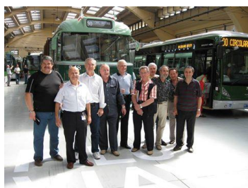
celebrazione 75° servizio filoviario-deposito Molise-2009

Le attività del Gruppo Storico sono molteplici, tutte tendenti a far conoscere il variegato mondo dei trasporti con particolare riferimento alla città di Milano e all'Azienda dei Trasporti Milanesi (ATM), espressione principale degli aderenti al sodalizio affiancata alla società civile. Per svolgere questo compito accomuna la passione dei trasporti con la ricerca e lo studio di tutte le tematiche afferenti a questo settore. Preservare la memoria storica e salvaguardare il patrimonio aziendale sono quindi i traguardi del Gruppo Storico. Si è infatti certi che il raggiungimento di siffatti obiettivi non può che consolidare in positivo non solo l'immagine dell'intera ATM ma costituire anche un rilevante elemento di aggregazione tra passato, presente e futuro.