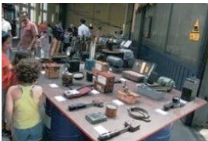
mostra di cimeli storici in occasione di un Porte Aperte di ATM