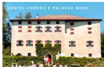
CASTEL COREDO E PALAZZO NERO